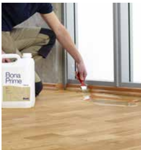
Základný lak sa aplikuje pred nanosením vrchného laku. Prime Classic, Bona