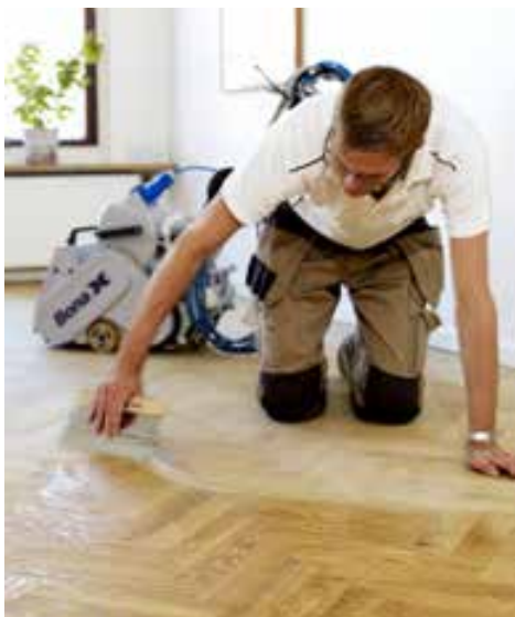
Škóry sa tmelia zmesou brúsneho prachu a transparentného tmelu. Mix & Fill, Bona